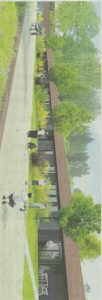
L'habitat pavillonnaire pour les aînés, tel qu'esquissé dans les premières études, est la première phase envisagée du nouveau quartier à Libin.

Idélux Projets Publics a réalisé une étude pour le futur quartier dédié aux aînés à Libin. La commune va chercher des partenaires privés.