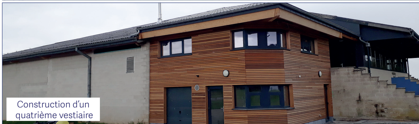
Construction d'un quatrième vestiaire