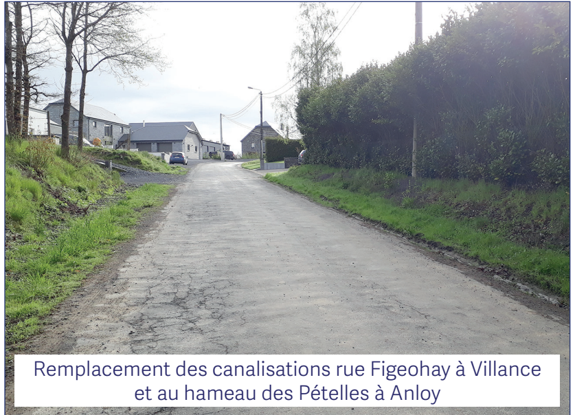
Remplacement des canalisations rue Figeohay à Villance et au hameau des Pételles à Anloy