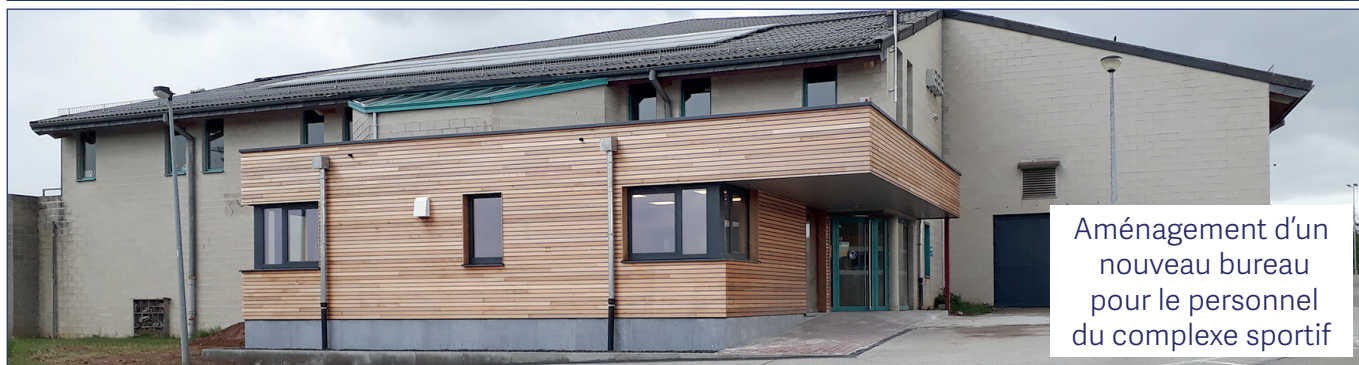
Aménagement d'un nouveau bureau pour le personnel du complexe sportif