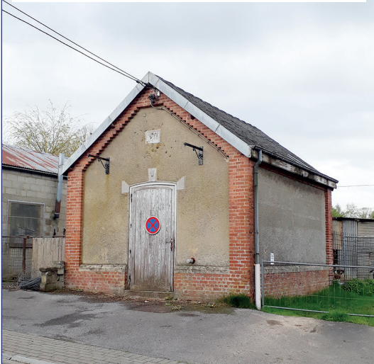
Travaux d'étanchéification des réservoirs d'Anloy et de Transinne