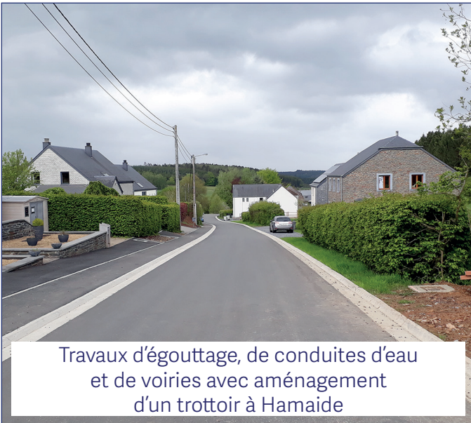
Travaux d'égouttage, de conduites d'eau et de voiries avec aménagement d'un trottoir à Hamaide