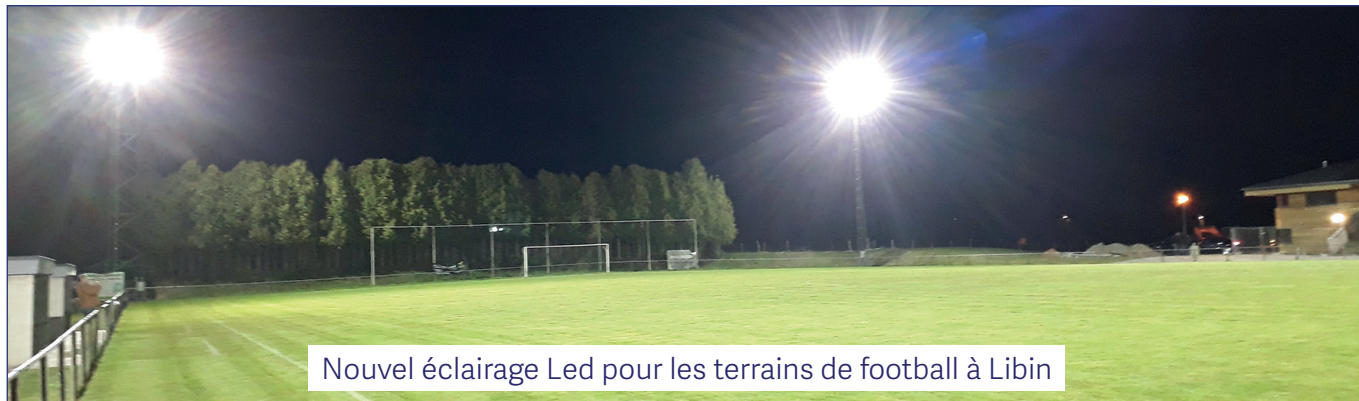
Nouvel éclairage Led pour les terrains de football à Libin