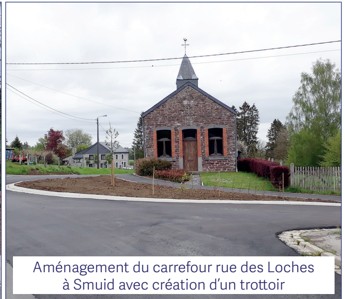
Aménagement du carrefour rue des Loches à Smuid avec création d'un trottoir